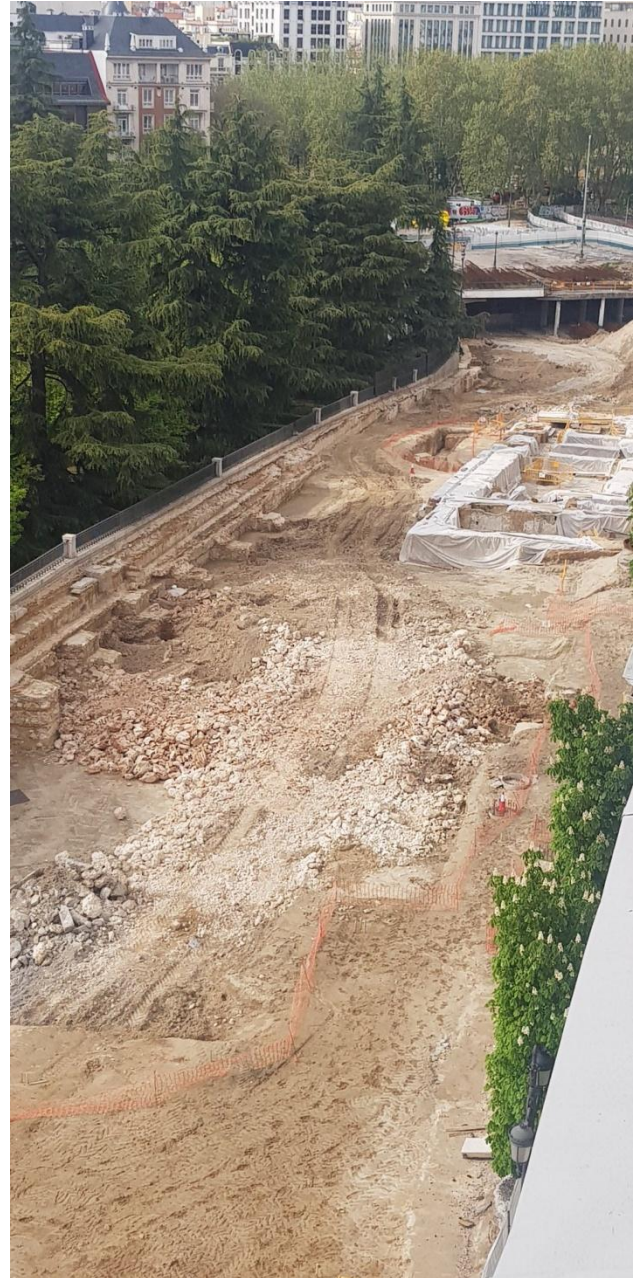
Estas dos imágenes de @felixmoreno86 permiten comparar los restos aparecidos y los que se han conservado