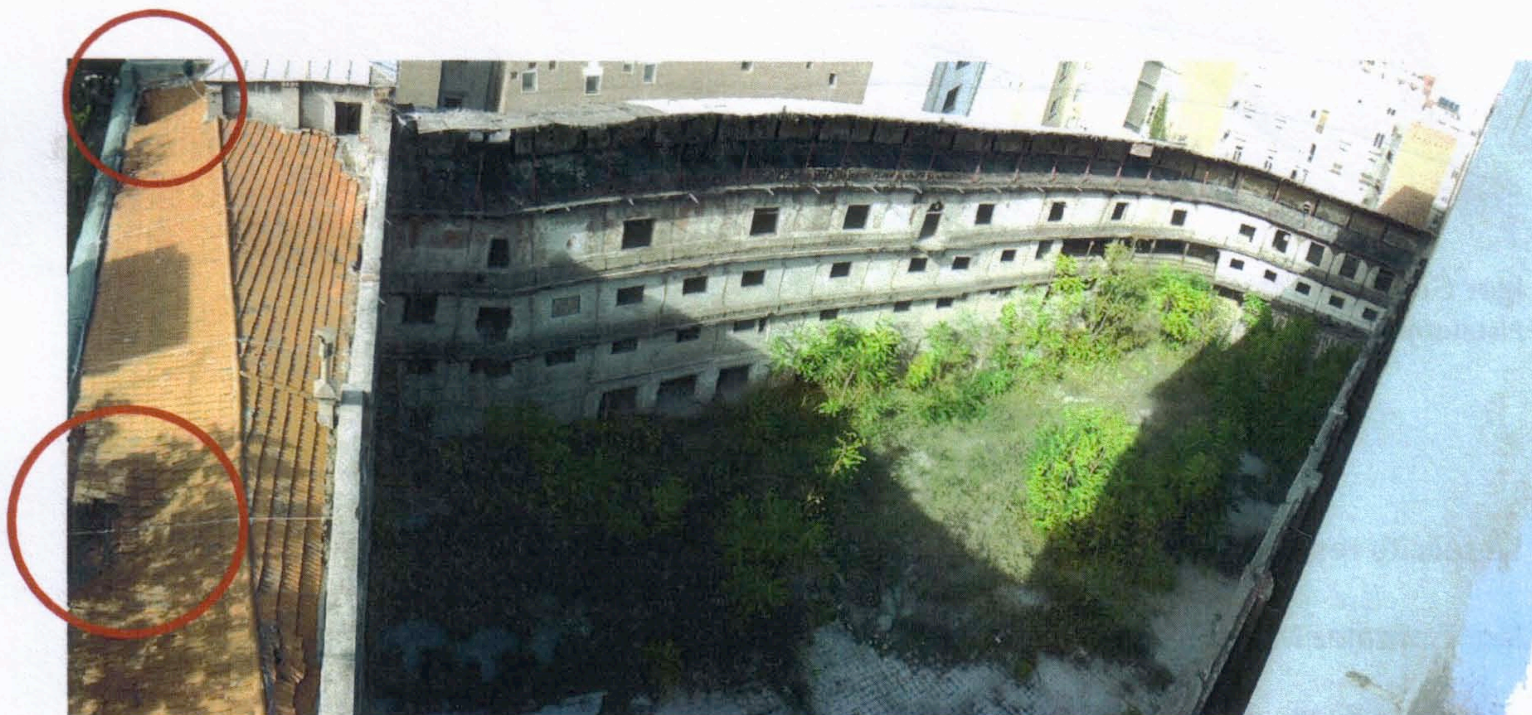
Imagen superior de la cubierta del Frontón Beti Jai, tomada el 13 de Noviembre de 2013, en rojo los dos hundimientos reconocibles.

Sin embargo, dos hundimientos producidos en el faldón del tejado que vierte hacia la calle Marqués de Riscal, ponen en riesgo la integridad del Bien.