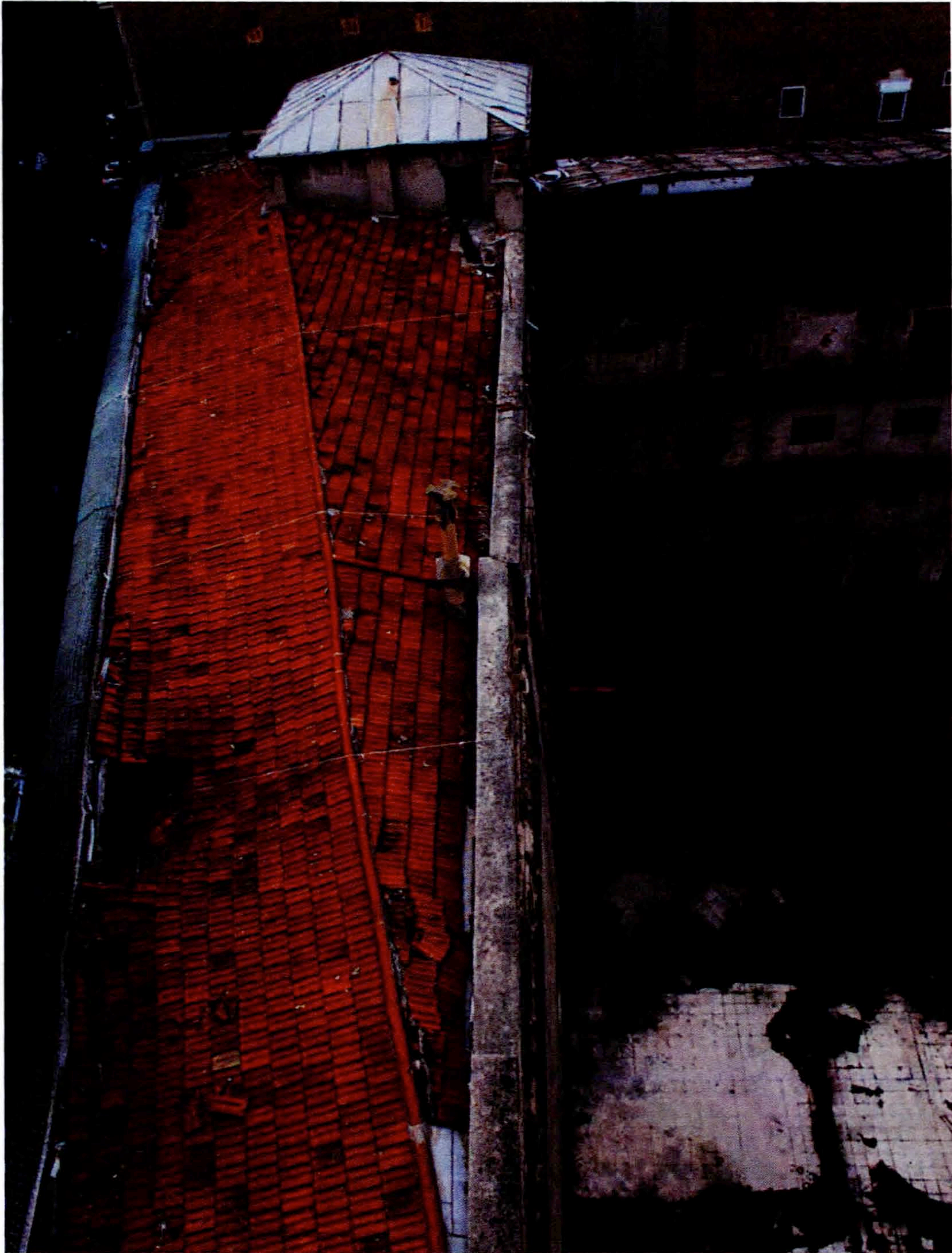
Imagen superior: Detalle de los hundimientos de la cubierta del Frontón Beti Jai, tomadas el 19 de Noviembre de 2013.

plataforma asociada a: MADRID CIUDADANÍA PATRIMONIO