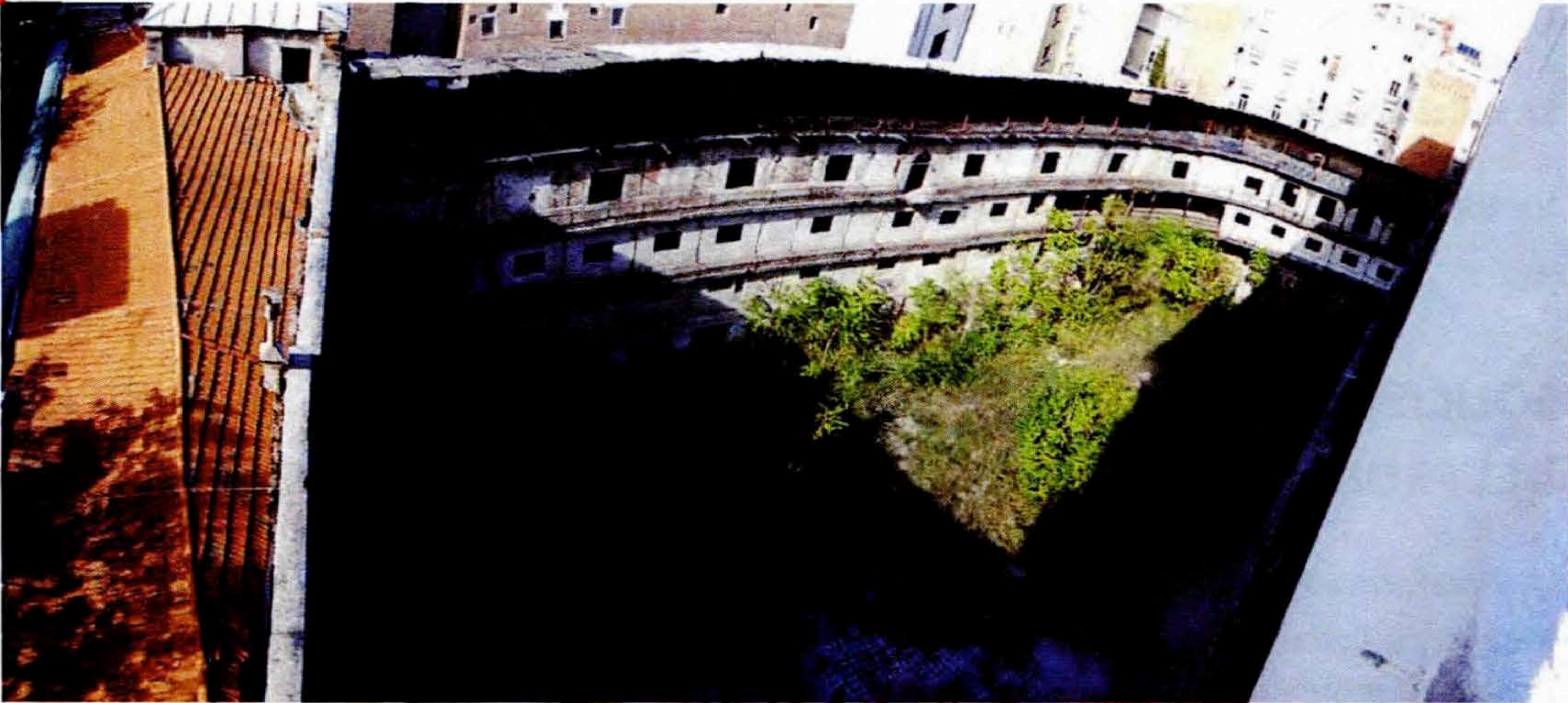
Imagen superior: Vista general de la cubierta del Frontón Beti Jai, tomada el 13 de Noviembre de 2013, en rojo los dos hundimientos reconocibles.