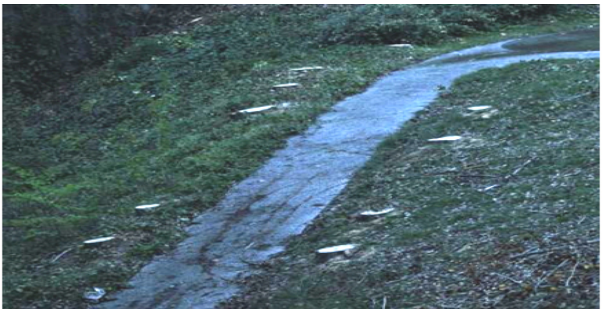
Tocones de la antigua alineación en un camino