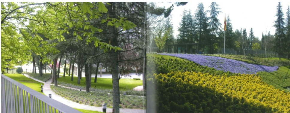
Rehabilitación de los jardines delanteros del Museo del Traje, por Gazapo-Lapayese, arquitectos

Según puede verse en la planta del jardín del MEAC dibujada por Leandro Silva, el arbolado se compone de pinos, liquidámbares, cedros, liriodendron, plátanos y chopos. La tala de noviembre ha destruido gran parte de estos árboles, en especial los chopos que dibujaban los contornos curvos y circulares de los senderos y del anfiteatro vegetal trasero y que se recorrían y contemplaban desde ventanales y terrazas del edificio. Actualmente el acceso a la zona del ángulo norte de la parcela está cerrado por vallas móviles que impiden el paso.