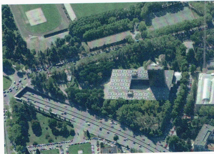
Vista aérea norte del conjunto del edificio y jardines del Museo del Traje. En primer término se observa ante el edificio el denso dosel arbóreo, desaparecido casi en su totalidad tras la tala de noviembre